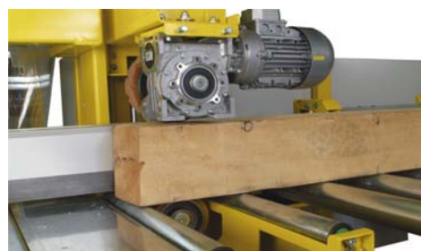
Duo - Vorschubaggregat mit unterer Andrückrolle