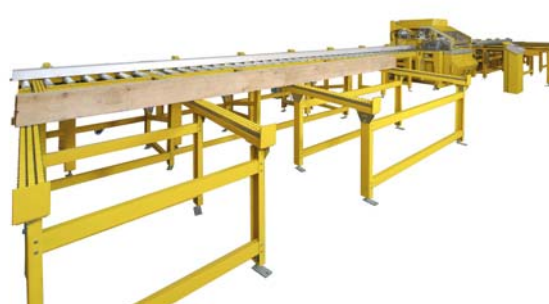
Entladestation mit Gleitleistensträngen und angetriebener Rollenbahn

AVOLA MASCHINENFABRIK A. Volkenborn GmbH & Co.KG. Heiskampstraße 11 D - 45527 Hattingen Postfach 800228 D - 45502 Hattingen Telefon +49 / 2324 / 96 36-0 Telefax +49 / 2324 / 96 36-50 E-Mail info@avola.de Internet www.avola.de