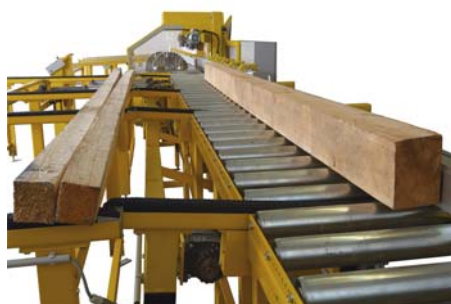
Beladestation mit Querförderern und angetriebener Rollenbahn